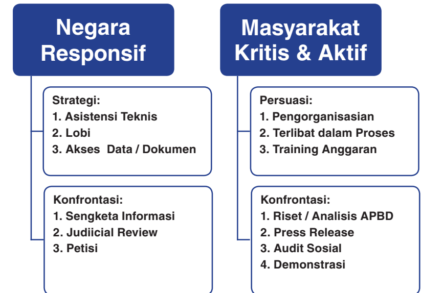
Diagram 3. Strategi Advokasi PPRG

Demonstrasi dilakukan untuk menyikapi sebuah kebijakan yang tidak memihak kepada kelompok perempuan, masyarakat miskin dan marginal lainnya serta untuk mengungkap kasus-kasus ketidakadilan yang dialami oleh mereka.