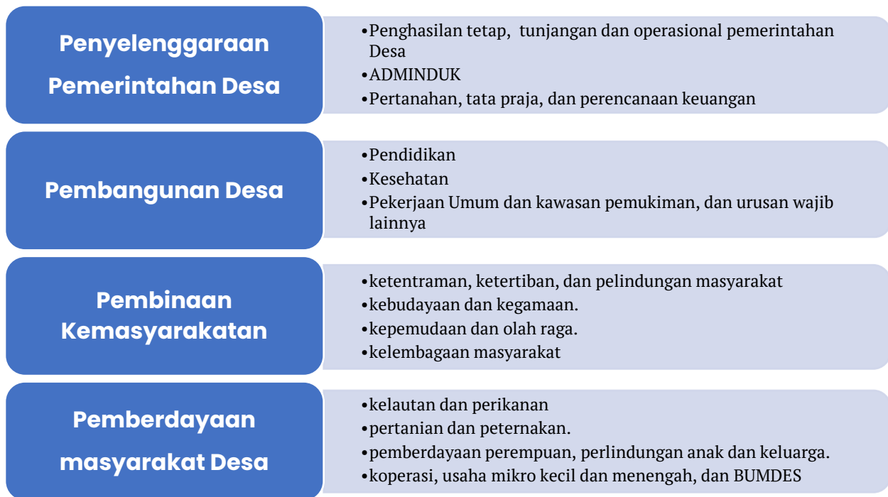
Gambar 2. Bagan Peruntukan ADD