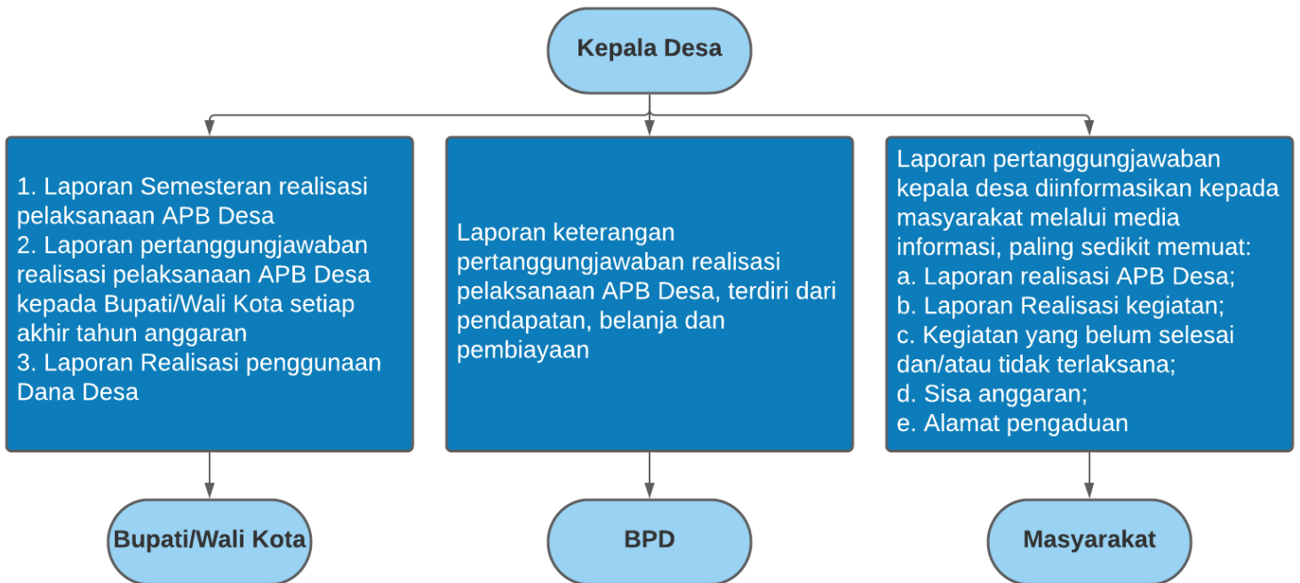
Gambar 3. Alur Pelaporan dan Akuntabilitas ADD.